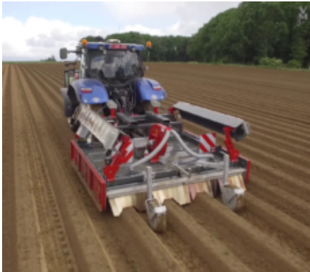
Brander met inschuifstukken