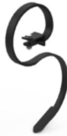
Dent vibrante; en option avec pate d'oie