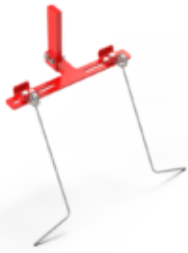
Dents à torsion sur connexion séparé (peut également être monté sur lame)