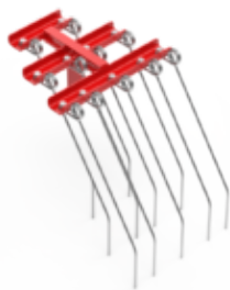
Élément herse étrille, disponible en différentes largeurs